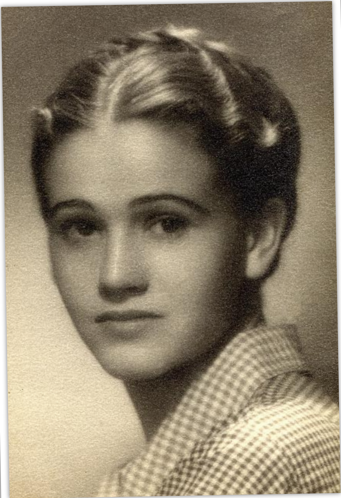
• La deslumbrante belleza de Elena Garro cuando era apenas una jovencita de 17 años.